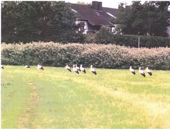
Storchenbilder – Nördlich Kalkumer Schlossallee